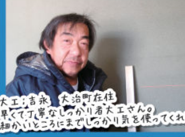
水道：溝部 中川区在住 堅実なイケメン水道屋さんの趣味はバス釣りで大会に出るほどの腕前。